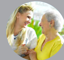
Aide à la personne